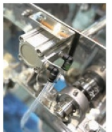
シリンダー式自動ロック

籠内容物の偏りによって異常な揺れを感知した場合は運転を緊急停止します。(内容物をならしてから再起動してください)